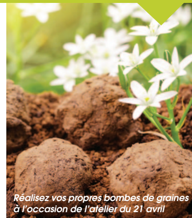
Réalisez vos propres bombes de graines à l'occasion de l'atelier du 21 avril

Apprenez à confectionner vos savons 100% naturels en maîtrisant la saponification à froid. Pensez à apporter des contenants tels que brique de jus de fruit ou lait, boîtes avec couvercles de margarine... ou mieux encore, des moules en silicone qui ne serviront qu'à la saponification et ne pourront plus avoir d'usage alimentaire.