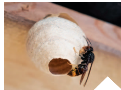
Au printemps, les reines fondatrices cherchent un endroit abrité pour bâtir leur nid primaire.