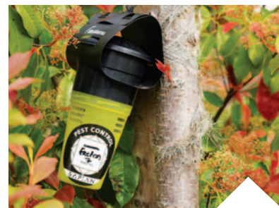
30 pièges à frelons asiatiques sont actuellement installés dans les parcs et jardins de la ville.

fondatrices avant qu'elles ne fassent leur nid définitif. Ainsi, 30 pièges sont actuellement répartis dans la commune et ont déjà permis de capturer 11 fondatrices. En effet, dès le début du printemps ces dernières cherchent un endroit abrité pour bâtir leur nid primaire, qui se présente comme une petite «cloche» de papier (photo ci-contre). Fort de cette information, pensez à inspecter vos abris de jardin, les encadrements des fenêtres, les avancées de toit... Le nid primaire doit être détruit à la tombée de la nuit, lorsque la reine se trouve à l'intérieur. La Ville accompagne financièrement la destruction des nids de frelons asiatiques, en allouant une aide de 100€, aux habitants procédant à la destruction d'un nid dans leur propriété, par l'intervention un professionnel certifié. Faites votre demande en ligne, sur le site internet de la Ville, en fournissant la facture d'intervention de la destruction datant de moins de 6 mois.