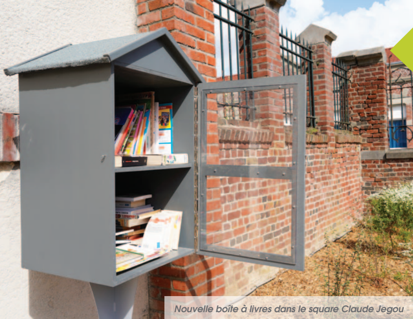
Nouvelle boîte à livres dans le square Claude Jegou