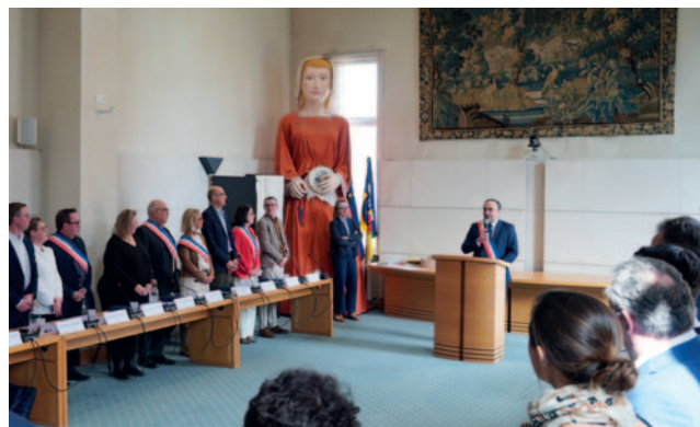
Sébastien Leprêtre, Maire de La Madeleine à l'occasion du Conseil Municipal d'installation.