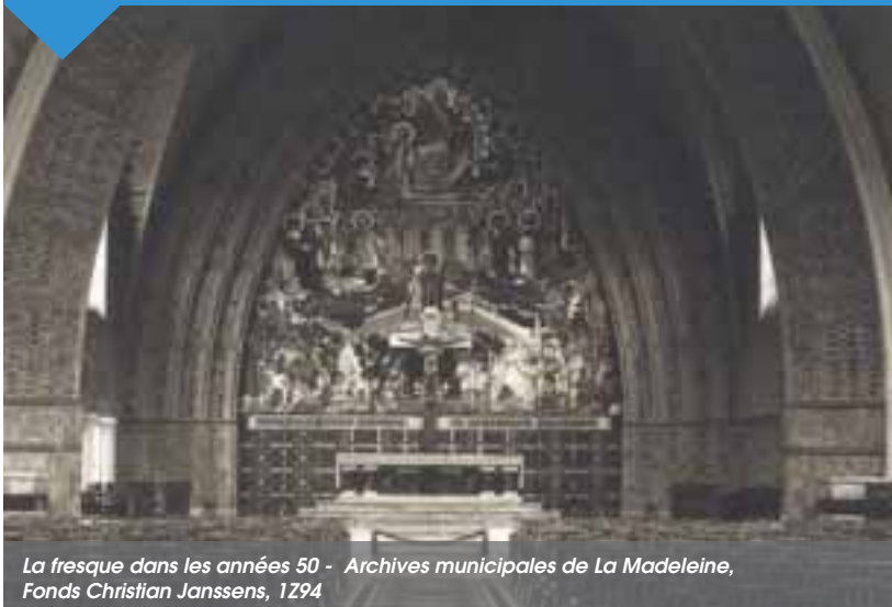
La fresque dans les années 50