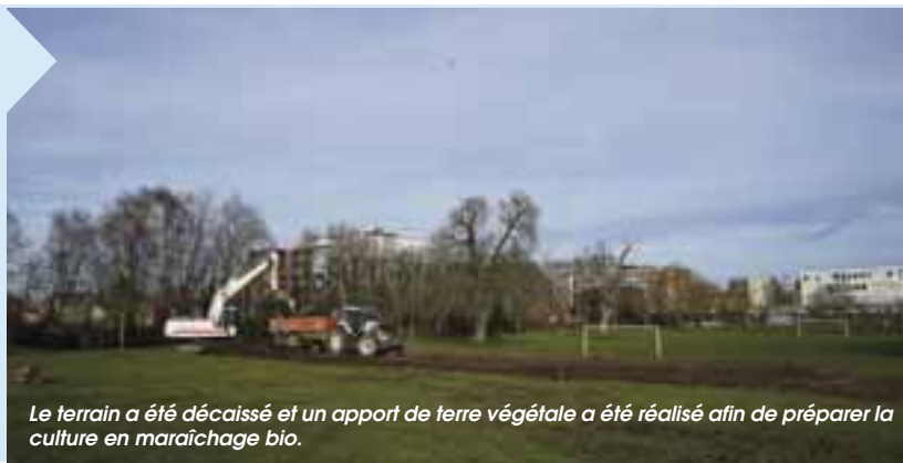
Le terrain a été décaissé et un apport de terre végétale a été réalisé afin de préparer la culture en maraîchage bio.

L'appel à candidatures pour la gestion de la ferme urbaine est ouvert jusqu'à fin mai. Des visites du site sont proposées aux candidats et le choix de l'exploitant sera arrêté dans l'année. Après le décaissement du terrain et l'apport de terre végétale, les travaux d'installation des serres seront engagés. Un engrais vert (type trèfle ou luzerne) sera également semé afin de préparer le sol pour le futur exploitant et de limiter le développement des mauvaises herbes. La parcelle est par ailleurs en cours de conversion pour l'obtention du label « maraîchage bio » d'ici 2 ans.