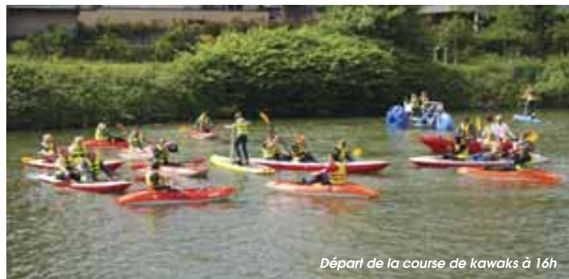
Départ de la course de kayaks à 16h